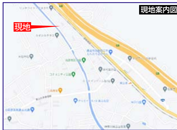
カーナビにセット！ 山北町向原1656(付近)